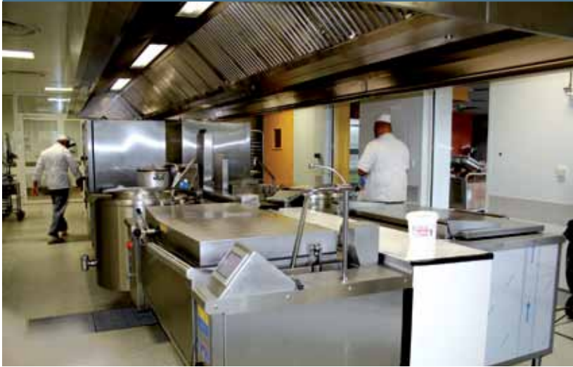
Cuisine centrale municipale