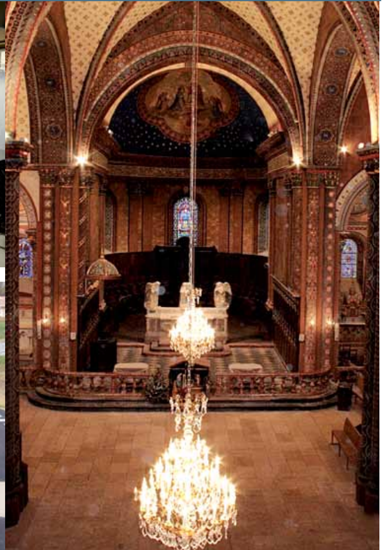
Cathédrale Saint Jean-Baptiste