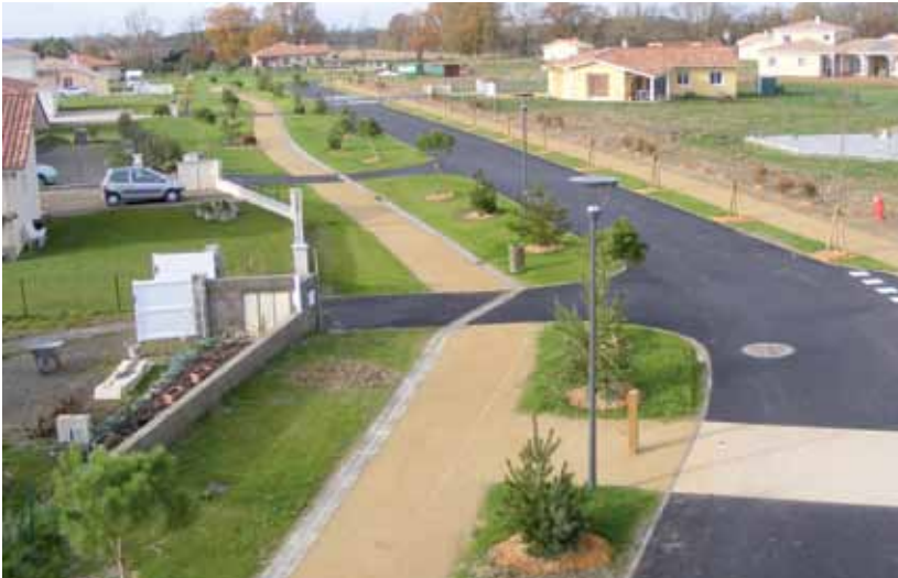
Lotissement Les Vergers de Chicas