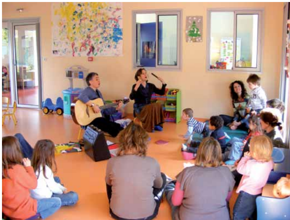
Atelier musical à la halte-garderie «Le jardin à malices» à Barcelonne du Gers

Suite à une enquête réalisée en 2008 auprès des familles ayant un enfant de moins de 6 ans et résidant sur le canton d'Aire sur l'Adour, la Communauté de Communes a décidé de lancer une halte-garderie itinérante, qui sera opérationnelle courant avril. Ce mode de garde « multi-accueil » répond à une mutation des rythmes de vie des parents observée depuis quelques années. Parallèlement à ce nouveau service, un Relais d'Assistantes Maternelles (RAM) vient de voir le jour.