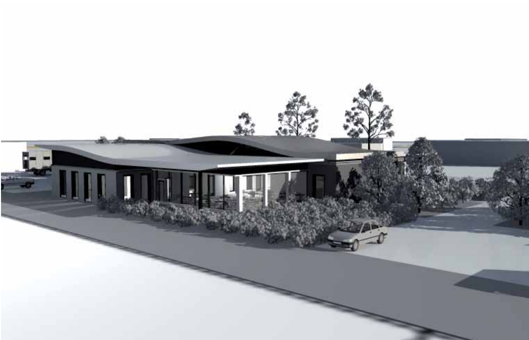
Le projet des cuisines centrales et du restaurant d'entreprises, situé dans la ZAC de Peyres, conçu par le cabinet d'architecte Dubedout.