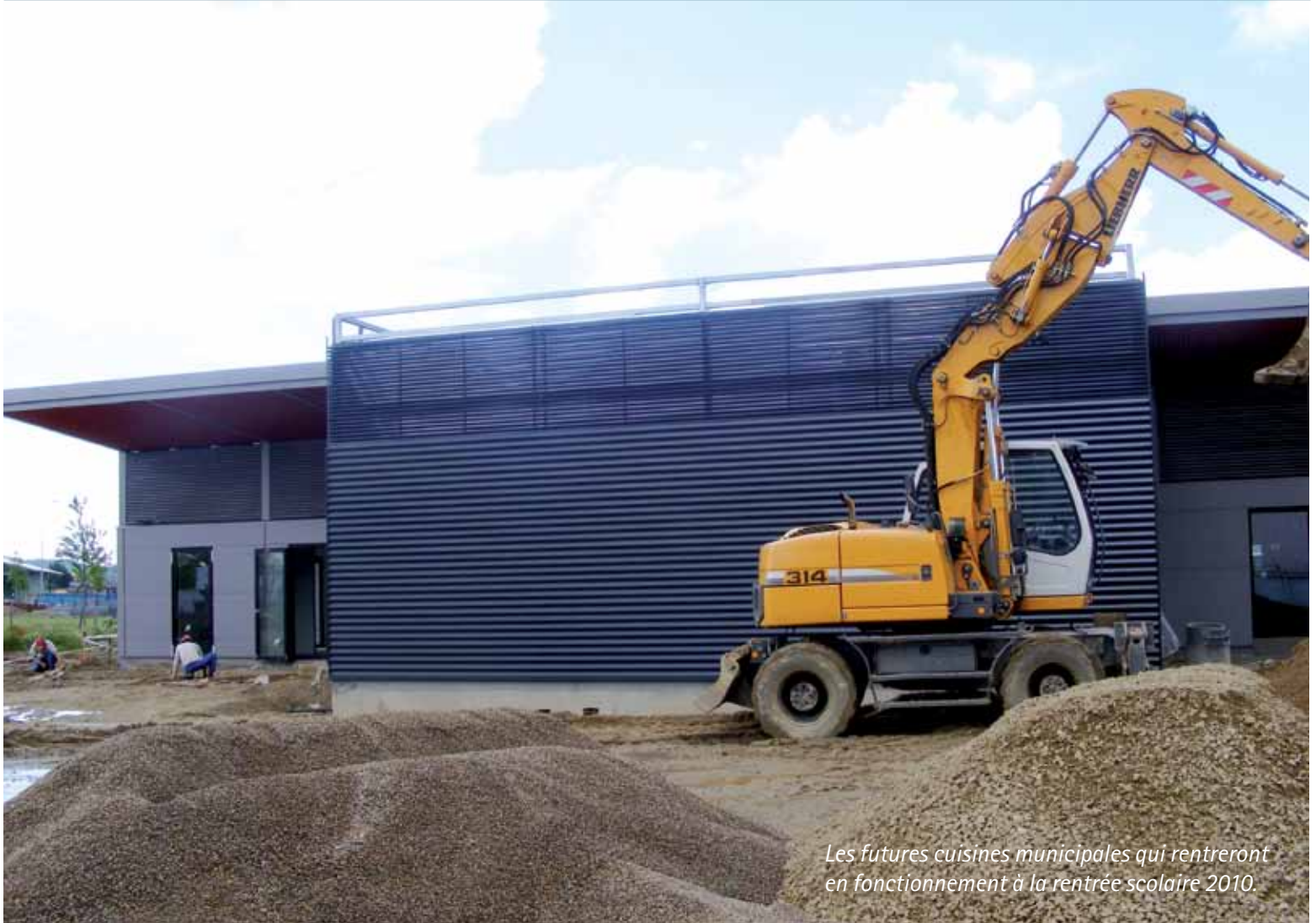
Les futures cuisines municipales qui rentreront en fonctionnement à la rentrée scolaire 2010.