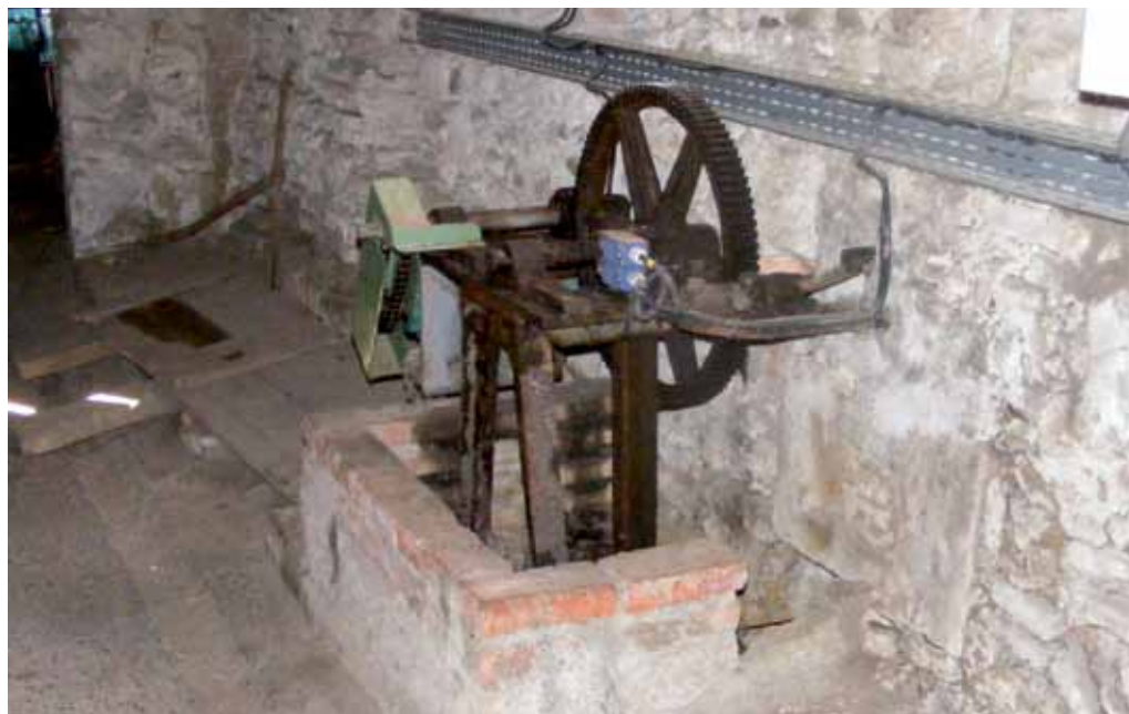
La rénovation de l'automatisation des vannes du moulin sera effectuée cette année : une réalisation de développement durable.

Le budget municipal d'Aire sur l'Adour s'élève pour l'année 2010 à 13,21 millions d'euros (8,43 millions d'euros pour la section de fonctionnement et 4,77 millions d'euros pour la section d'investissement).