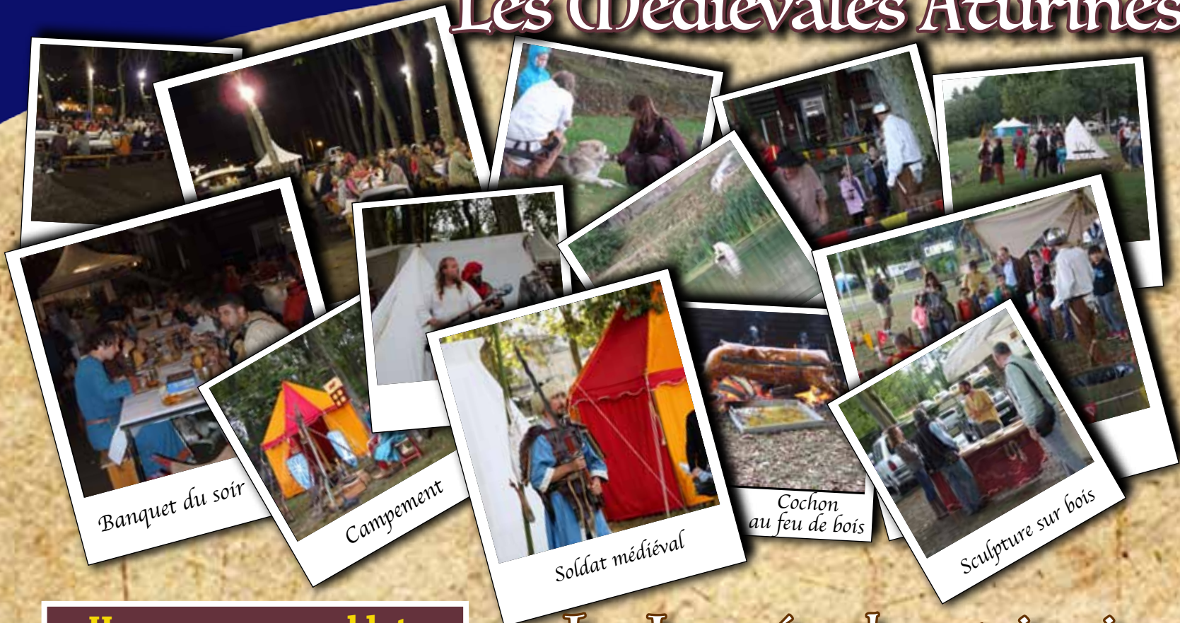
Banquet du soir