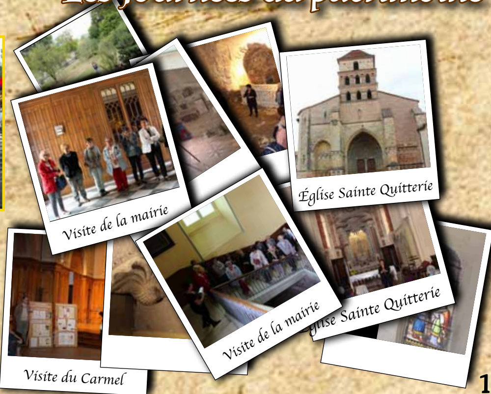
Visite de la mairie