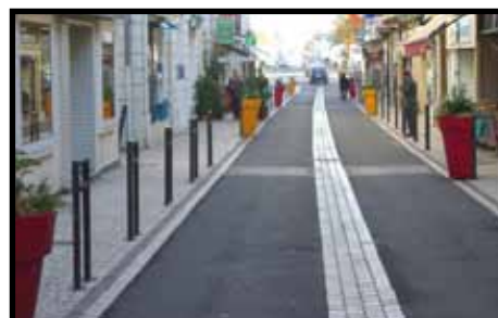
Aménagement de la rue Gambetta