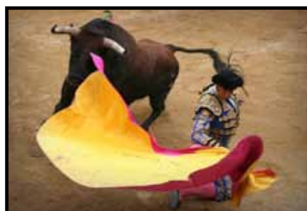
Matador Mehdi Savalli À l'affiche le 21 juin comme triomphateur de l'an dernier