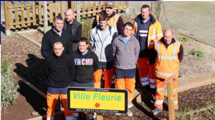
L'équipe des Espaces Verts