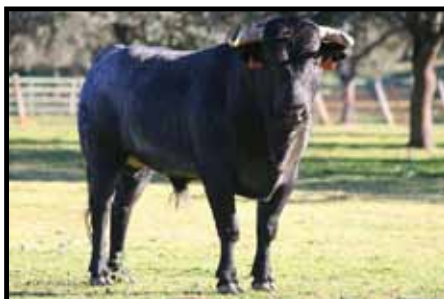
Novillo de Pablo Mayoral Combattu le 1er mai lors de la novillada concours

3 ème dimanche de juin, pour les fêtes patronales