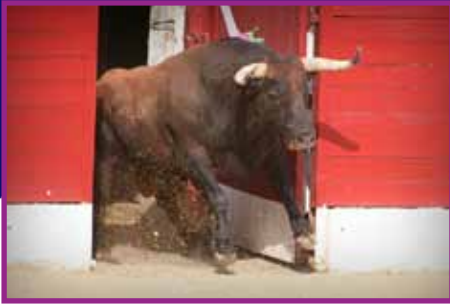
Toro de Baltasar Iban à sa sortie du toril l'an dernier

Forte d'une expérience et d'une certaine légitimité, la Junta des Peñas s'est vu confiée cette année, par la municipalité, la gestion des Arènes et l'organisation des spectacles taurins, avec l'ambition de redonner à la cinquième arène du Sud-Ouest une identité en adéquation avec l'afición locale.