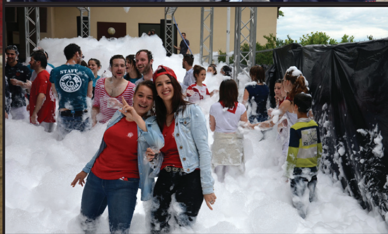
L'animation Mousse...Tâche, une nouveauté qui a rencontré un véritable succès