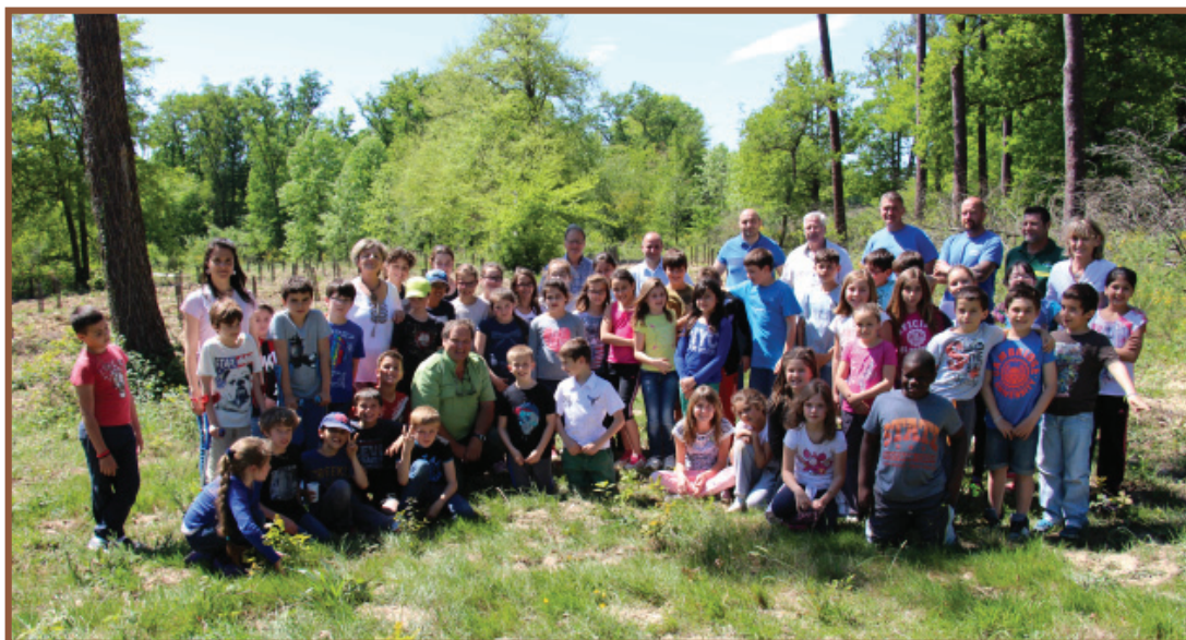
Les élèves des classes de CM1 et CM2 de l'École St Joseph étaient réunis et accompagnés d'élus, d'agents municipaux des Espaces Verts, du Directeur des Services Techniques et de deux agents de l'ONF

À cette occasion ils ont pu découvrir l'importance et la complexité de la plantation dans les espaces naturels et la fragilité de notre environnement.