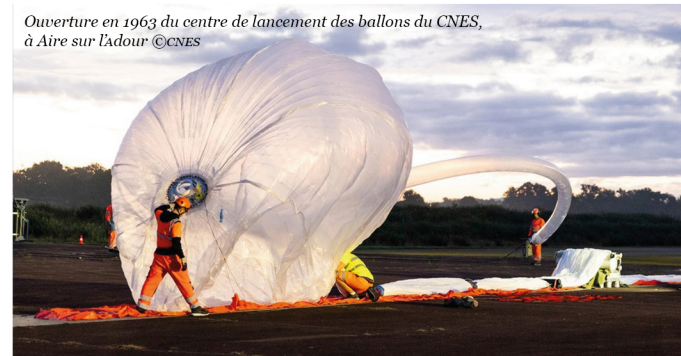
Ouverture en 1963 du centre de lancement des ballons du CNES, à Aire sur l'Adour

Le samedi 4 octobre 2025, le CNES a ouvert exceptionnellement les portes de son centre d' Aire sur l'Adour pour fêter ses 60 ans et 1200 personnes ont pu découvrir les coulisses de ce lieu habituellement fermé, assister à des démonstrations spectaculaires et rencontrer les équipes passionnées qui œuvrent chaque jour à la conquête du ciel. Pour les habitants comme pour la région, la présence du CNES est une véritable chance : elle fait rayonner la ville bien au-delà de ses frontières et en fait un territoire résolument tourné vers l'avenir et l'innovation.