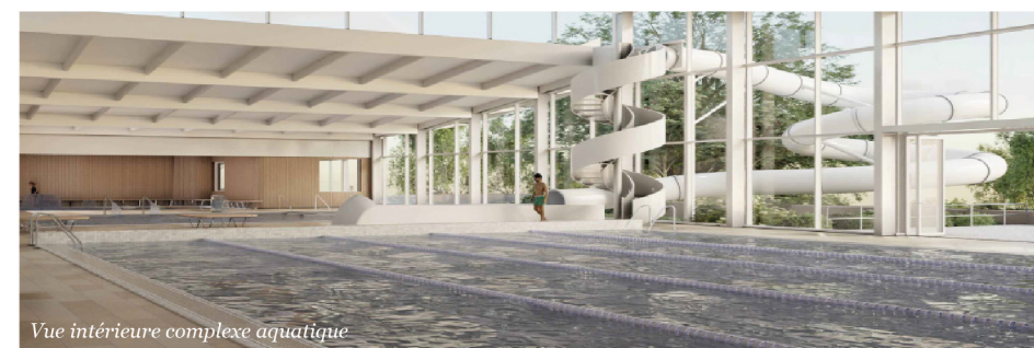
Vue intérieure complexe aquatique

Vous êtes nombreux à suivre avec intérêt le projet de la future piscine ! Faisons ensemble un point sur son avancement et les belles perspectives à venir. Un premier pas a déjà été franchi: un arrêté préfectoral portant « examen au cas par cas » a confirmé que le projet n'était pas soumis à une autorisation environnementale. Une excellente nouvelle qui permet d'avancer sereinement. Deux dossiers ont été déposés et sont en cours d'instructions : auprès de la DDTM (Direction Départementale des Territoires et de la Mer) pour ce qui concerne la loi sur l'eau et les zones humides,