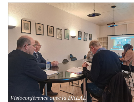
Visioconférence avec la DREAL

L'objectif est clair : proposer un lieu moderne, accessible et convivial, pensé pour toutes les générations. Nous continuerons à vous tenir informés au fur et à mesure des avancées, afin que chacun puisse suivre pas à pas la réalisation de ce projet.